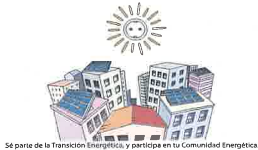
Sé parte de la Transición Energética, y participa en tu Comunidad Energética.

En definitiva, las Comunidades Energéticas se construyen sobre el concepto de autoconsumo energético local. Es decir, la producción de energía para uso propio, individual o colectivo y en el mismo lugar que se genera. La idea no es nueva pero sí ha ganado relevancia en los últimos años, adquiriendo importancia para acelerar la transición hacia un sistema energético sin emisiones de CO2 además del importante ahorro económico que supone para los consumidores y la práctica finalidad de la pobreza energética.