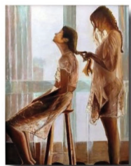
"SERENIDAD" de Ramiro Allier, ganador año 2020

TEMÁTICA: Superación MUJER Y RESILIENCIA PREMIOS: 300€, 200€, 100€, PREMIO DEL PÚBLICO: 75€, REVELACIÓN: 75€ PLAZO DE ADMISIÓN: DEL 23 DE FEBRERO AL 5 DE MARZO de 2021 EXPOSICIÓN EN NUESTRO FACEBOOK: DEL 8 AL 14 DE MARZO FALLO DEL JURADO: LUNES 15 DE MARZO