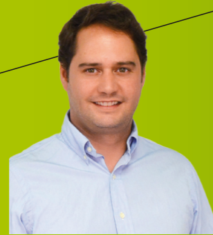
IGNACIO VÁZQUEZ CASAVILLA Alcalde de Torrejón de Ardoz