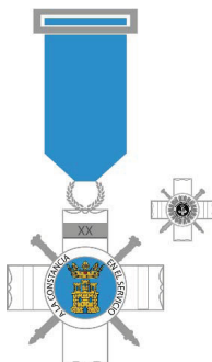
Cruz a la Constancia en el Servicio Distintivo Plata (20 años)