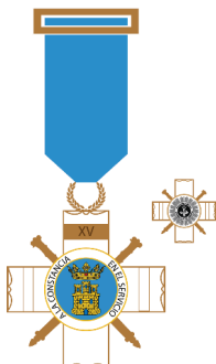
Cruz a la Constancia en el Servicio Distintivo Bronce (15 años)