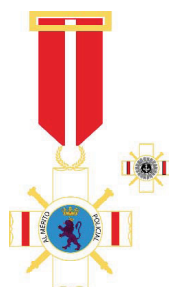
Cruz al Mérito Profesional Distintivo Rojo